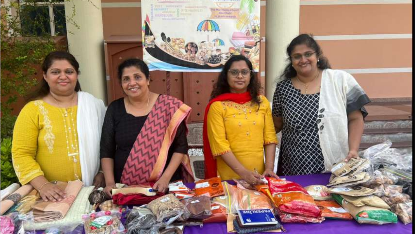
Our Sevika Sangham Team at the Sales Table