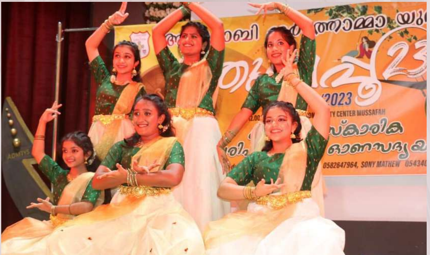
Our Children performing a fusion dance